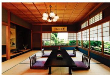
<離れ 2F AOGIRI 「栞」> 4～8名様