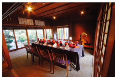
<離れ 1F THE HONJIN> 4～14名様